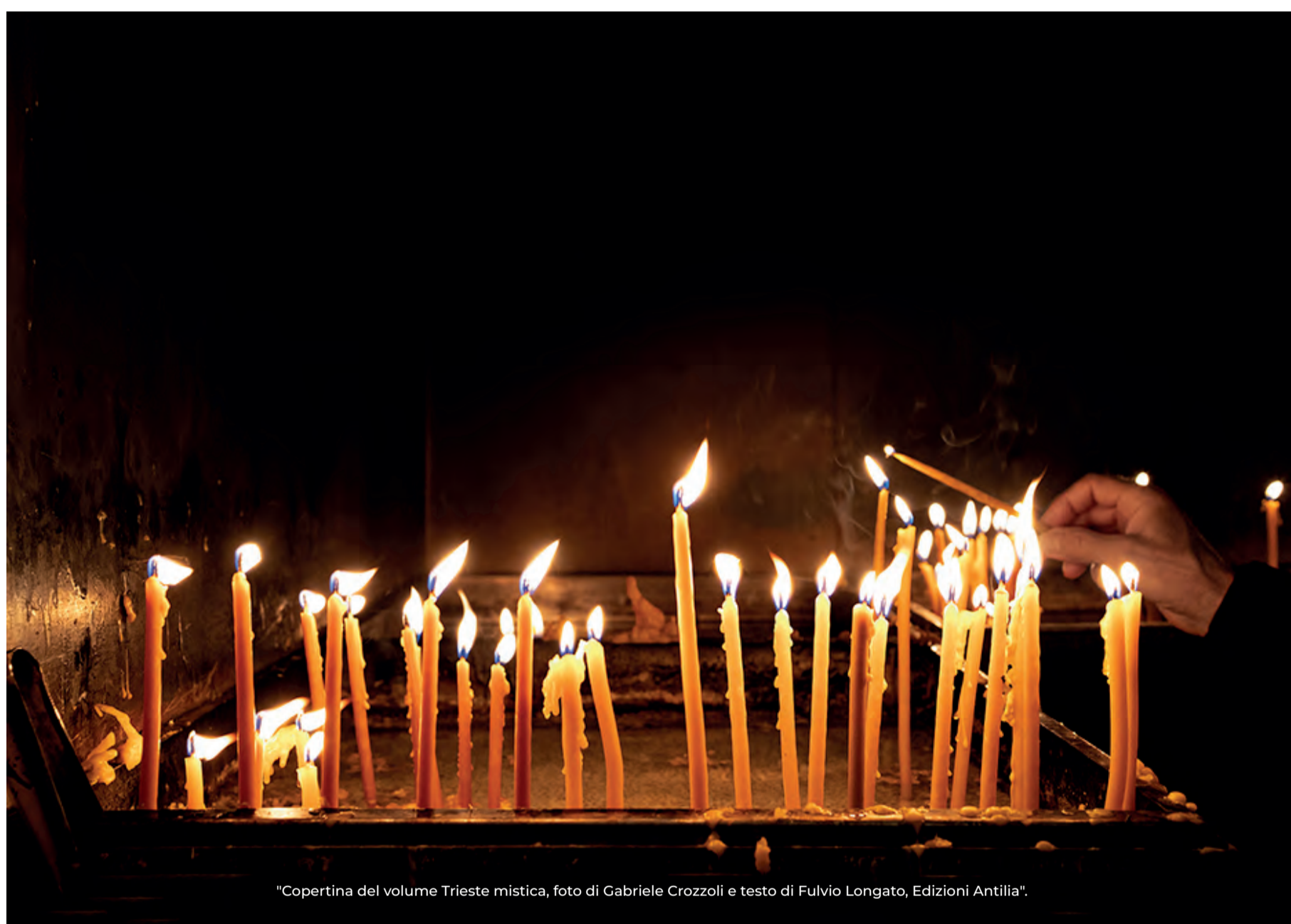
"Copertina del volume Trieste mistica, foto di Gabriele Crozzoli e testo di Fulvio Longato, Edizioni Antilia".